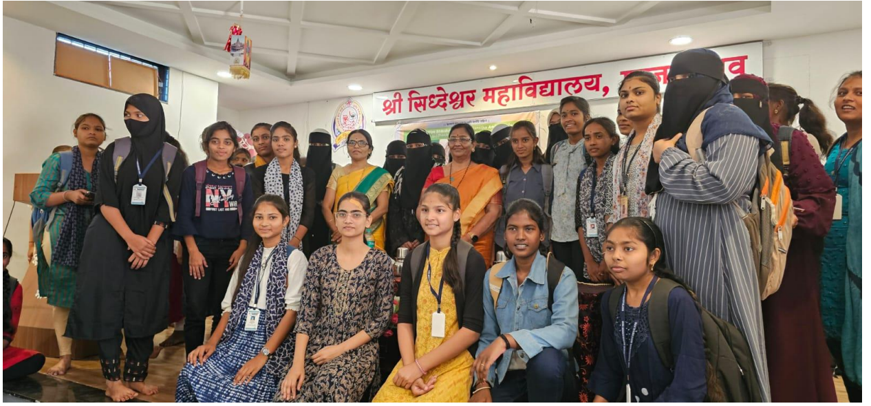
Appreciation by students with photograph