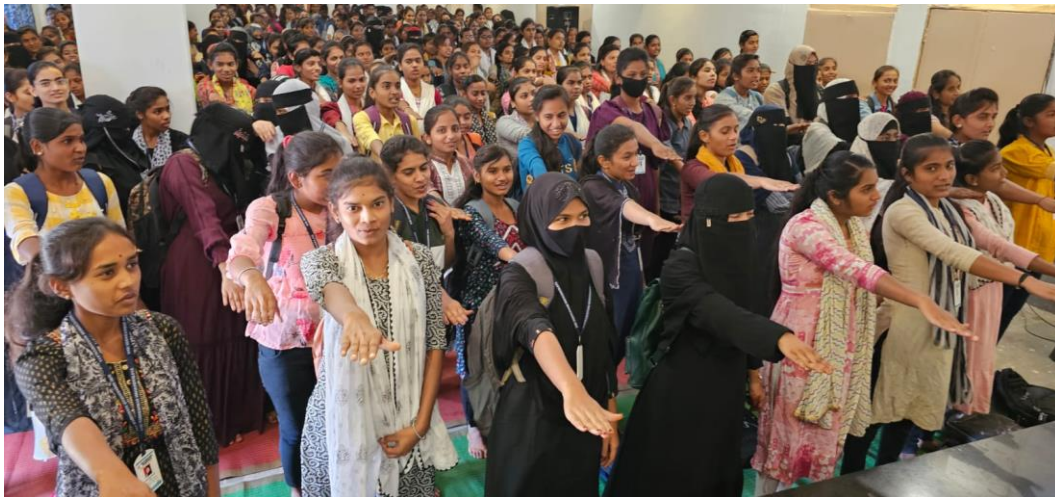
The oath given to students about the optimum use of mobile phone