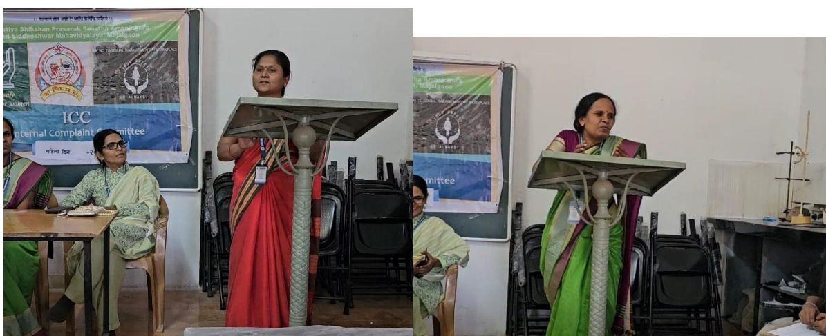
Geet Gayan by Pratibha Jadha Madam