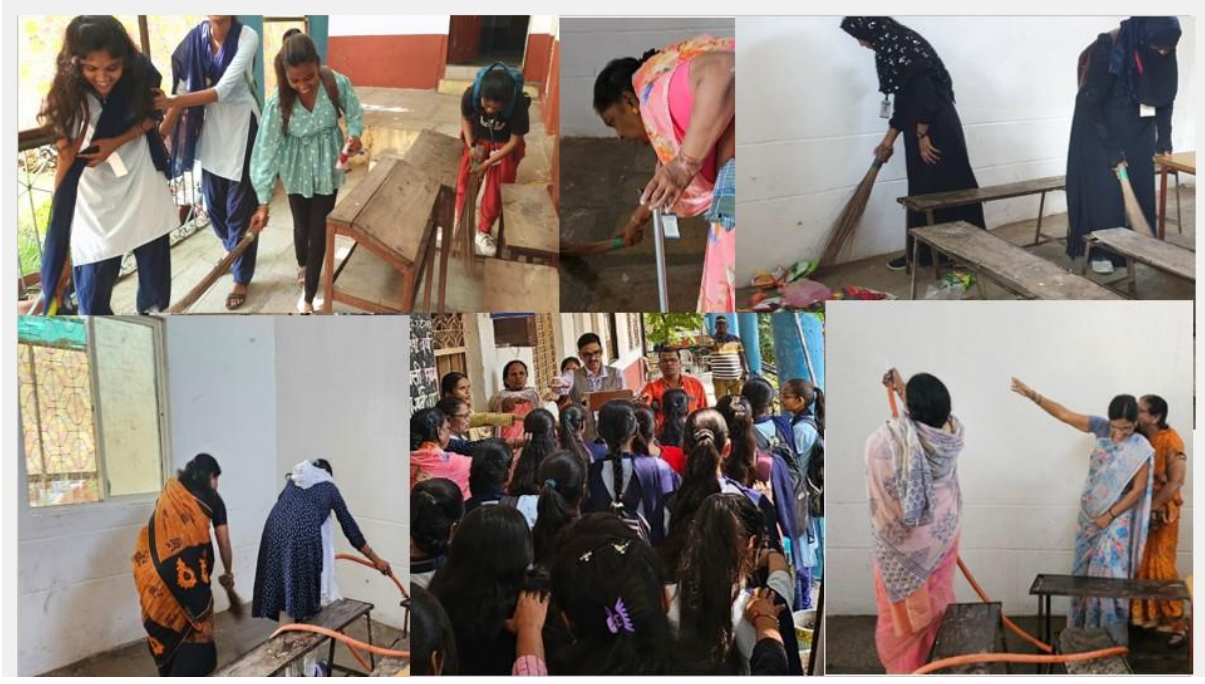
Ladies room Cleanliness on the occasion of Shardotsav 2023-24