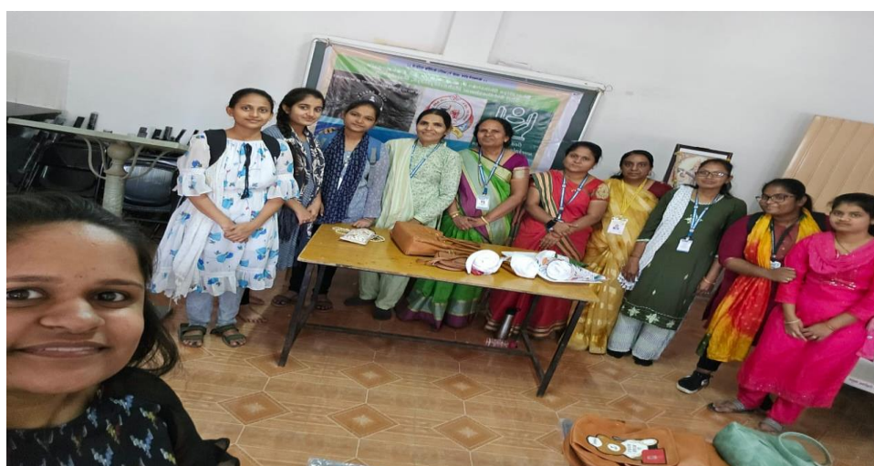
Appreciation by students with photograph