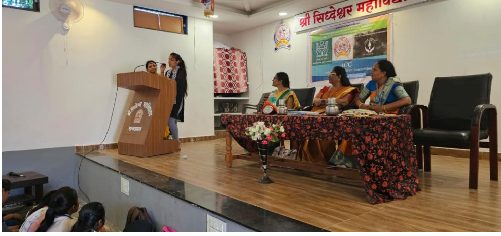
Spontaneous Student Feedback