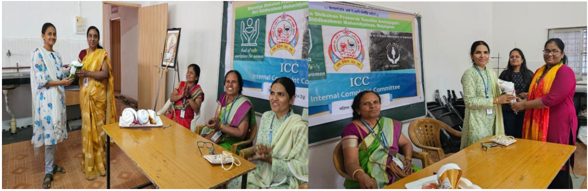
Felicitations of Teachers by Students